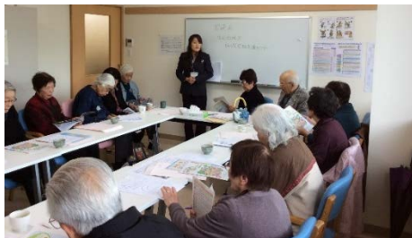
高齢者クラブの総会