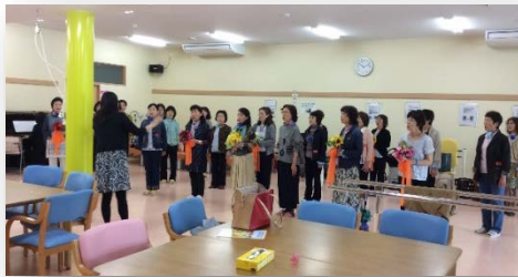
ママさんコーラスの練習

多目的室は自治会や老人会の会合や健康教室など、また地域の皆様の集会所やサロンとして開放しております。また、休業日（日祝日）は地域皆様の団体活動（コーラス、舞踊などの練習）へも無料で開放しております。お気軽にお問い合わせください。