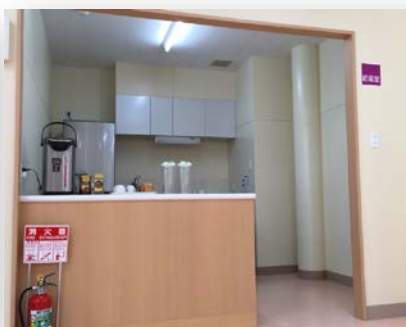
左：食堂、 右：パントリー