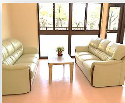
左：リラクゼーションルーム 右：談話コーナー