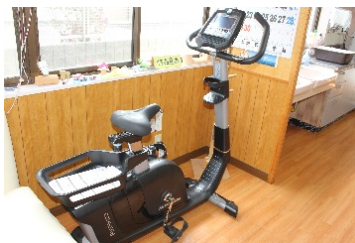
トレーニングマシン